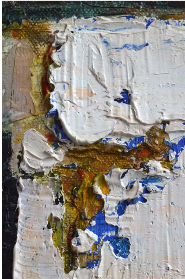
Figure 4 : Henriette Fauteux-Massé, Recueil (détail), vers 1960-66 huile sur toile, 40,5 x 14 cm, Collection Édith-Anne Pageot

Aussi séduisante qu'elle soit, cette lecture reste enfermée dans une logique autoréférentielle et sectaire. Elle occulte les affinités entre la grille et la trame et, du coup, les rapports, les transactions, les échanges et les transferts complexes entre l'art moderne et les arts de la fibre. Pour l'artiste et designer, théoricienne du textile Anni Albers, la grille est certes un élément organisateur et structurant, mais encore, en tant que métaphore de la trame propre à l'ouvrage tissé, elle revêt un caractère pliable et flexible 33 . Jennifer Scanlan résume en ces mots la posture théorique que d'Albers :