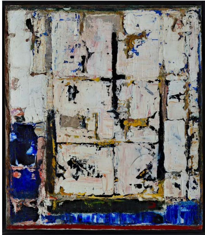
Figure 3 : Henriette Fauteux-Massé, Recueil , vers 1960-66, huile sur toile, 40,5 x 14 cm Collection Édith-Anne Pageot

On se rappellera que dans son article « Grilles » ( Grids ), aujourd'hui notoire, tout comme dans The Grid, the True Cross, the Abstract Structure (1995), Rosalind Krauss voit dans la grille « l'emblème de l'ambition moderniste 31 » et, à la fois, le « mythe » 32 de l'art moderne. À partir d'une posture théorique inspirée du structuralisme, l'auteure vise à mettre en évidence la nature profondément ambivalente de la grille. Principe de composition ubiquitaire, plat, géométrique et ordonné, la grille résolument abstraite et conceptuelle incarnerait les conditions logiques de la vision et, à ce titre, elle serait emblématique du présumé processus d'autonomisation qui caractériserait la peinture moderne, allant du cubisme à De Stijl, Mondrian, Malevitch, Jasper Johns et Agnes Martin. Reprenant les propos de plusieurs artistes, nombreux à aspirer à un langage universel empreint de métaphysique ou de spiritualité, Krauss soutient encore que la grille aurait permis de résoudre les contradictions entre le matérialisme positiviste moderne (profane) et une réalité incommensurable (sacrée) qui échappe à la finitude du cadre. Espace paradoxal donc, la grille serait à la fois « centripète » et « centrifuge », matérialiste et partie constitutive d'un espace plus vaste, emblème et mythe de l'art moderne, simultanément.