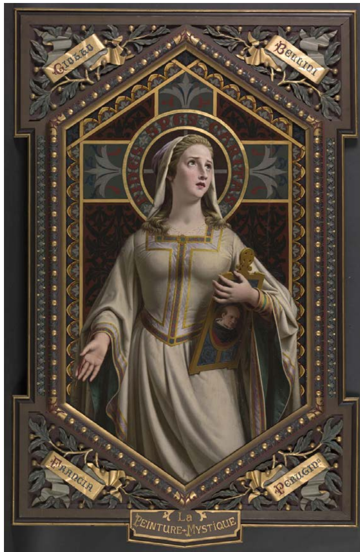
Figure 3 : Napoléon Bourassa (1827-1916), La Peinture mystique, 1896-1897, huile sur bois, 153,5 x 88,5 cm, Québec, Musée national des beaux-arts du Québec, Don de la succession Bourassa en 1941. Restauration effectuée par l'Institut canadien de conservation du ministère du Patrimoine canadien (1943-55.213).

Aborder l'œuvre de Bourassa par l'image, c'est à la fois apporter une réponse intellectuelle à ce qu'il montre et participer à l'acte créatif qui se joue devant nous. Nous ne sommes pas face à une œuvre pour en apprécier seulement la justesse du métier mais nous sommes confrontés à un mouvement qui nous est adressé. C'est le sens premier de La Peinture mystique (fig. 3). Avant d'y venir, il nous faut faire un détour de méthode pour comprendre que la surface picturale, qu'il adresse à un spectateur, agit comme un écran visuel qui, à son tour, ouvre l'œil vers un dispositif