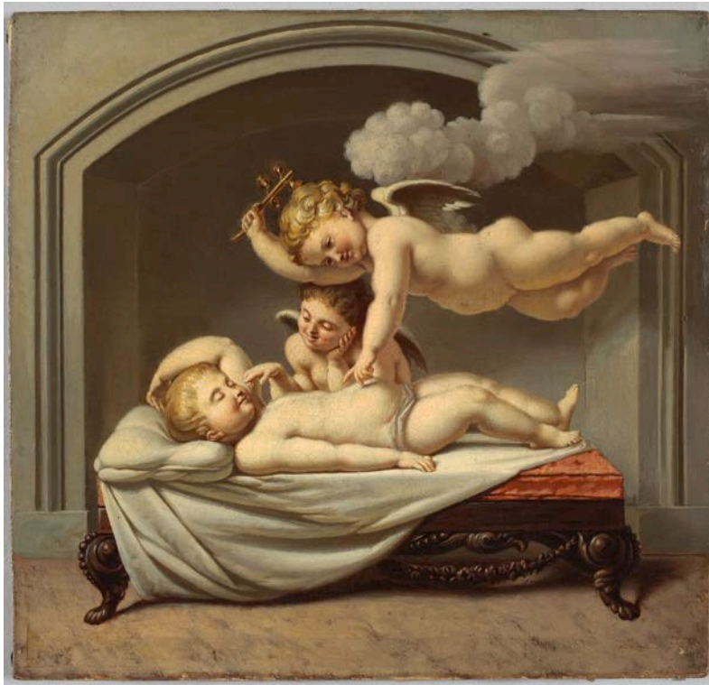
Figure 2 : Napoléon Bourassa (1827-1916), La Légende du berceau : L'enfant sourit aux anges, vers 1881, huile sur toile, 27,1 x 28,2 cm, Ottawa, Musée des beaux-arts du Canada. Morceau de réception à l'Académie royale des arts du Canada, déposé par l'artiste, Montréal, 1881.

fait le fil conducteur de ses récits, avec des pour et des contre, de telle sorte que le regard s'y limite et s'y enferme. L'œil risque vite de se lasser et de faire en sorte que des qualificatifs comme « mièvre, secs et rigides » surgissent d'eux-mêmes, comme critères de jugement.