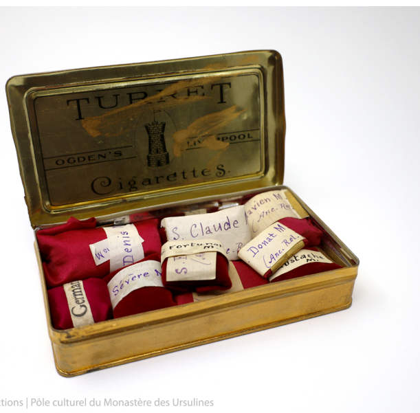
Figure 7. Reliques dans une boîte de cigarettes Turret, par la Ogden's Tobacco Company, 1 re moitié du XX e siècle, 2013.0582.