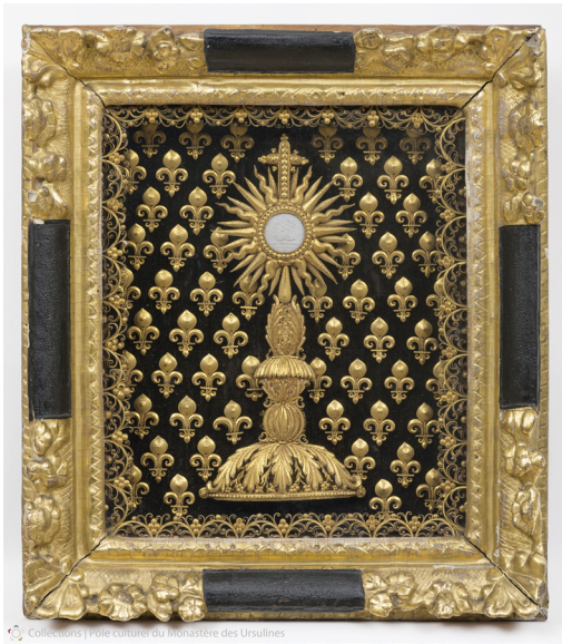
Figure 4. Anonyme, Reliquaire à agnus dei en paperole (France), XVIII e siècle, 1995.2199.