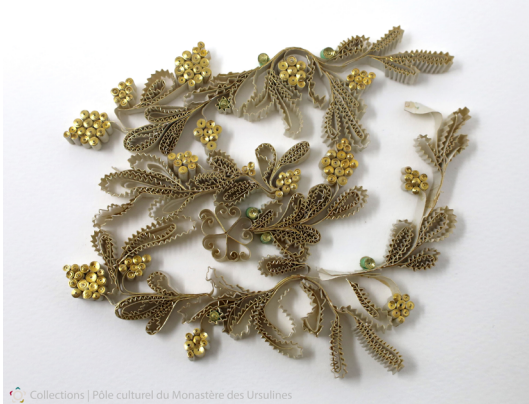
Figure 6. Échantillons de paperole, 2003.0095.1, 2003.0095.2, 2003.0095.3.