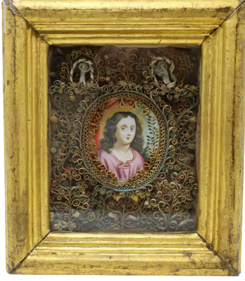
Figure 5. Anonyme, Reliquaires avec paperole, XVIII e -XIX e siècles, 1995.2204, 2013.0527 et 1995.2203.