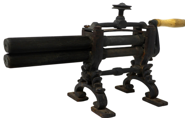
Figure 8. Papier pour paperoles, 1997.1734, et machine à plisser, PI-2024.0077.