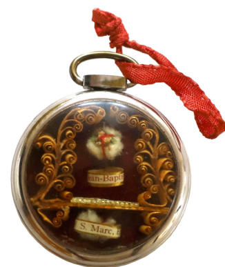
Figure 10. Anonyme, Reliquaire de Notre-Dame-de-Liesse, de Notre-Dame-de-Lorette, etc., et reliquaire de sainte Anne, 2013.0809.4 ; PI-2013.0547.2.